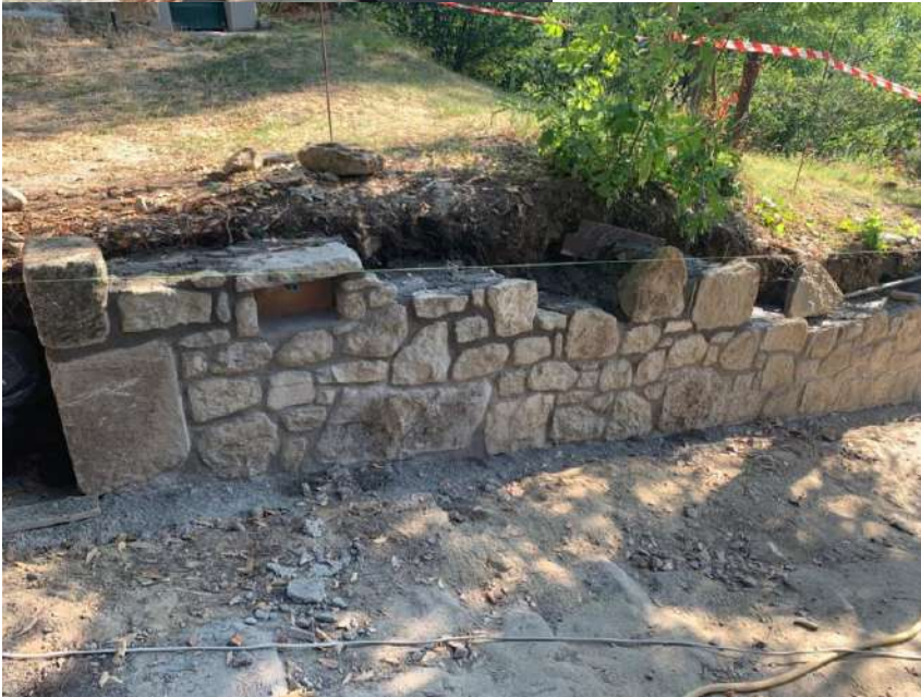
C3 – Stato attuale